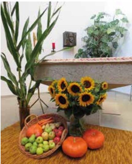
Erntedank in Brünisried