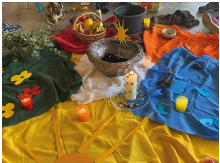
Foto: Kinderfeier zu Erntedank am 22. September 2023 in St. Silvester