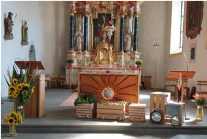
Erntedank in Rechthalten